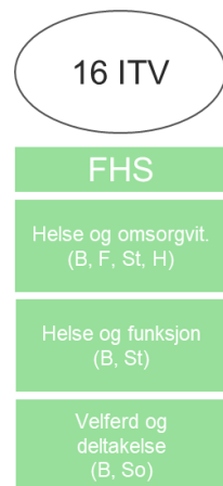
Figur 1 Studentrådet FHS, med dagens instituttstruktur

75 På de minste campusene, Førde og Stord, vil man med arbeidsutvalgets 76 modell få ganske små studentutvalg (henholdsvis fire i Førde og åtte på 77 Stord). Dette for eksempel løses ved at man velger en vararepresentant per 78 instituttillitsvalgt som får anledning til å delta i møtene. Det vil gi et 79 kollegium som er noe større, og forhåpentligvis bedre i stand til å velge 80 campusrepresentant. Arbeidsutvalget er i dialog med studentrådene for å 81 finne lokale tilpasninger som ivaretar de demokratiske prinsippene i 82 modellen og studentkulturen på studiestedene.