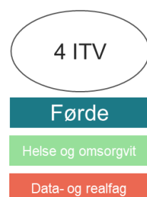
Figur 3 Studentutvalget Førde, med dagens instituttstruktur